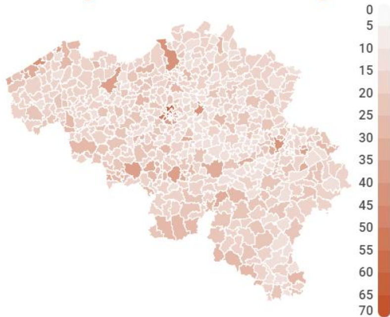
Percentage huishoudens zonder wagen