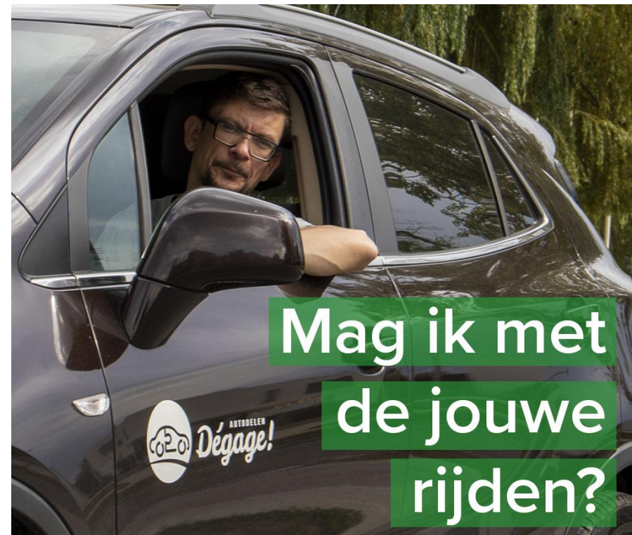
Flyer die Deinse autobezitters oproept om hun wagen te delen met andere inwoners

Aanbod wordt natuurlijk door mensen zelf gecreëerd. De angst dat er (te) weinig gebruikers zullen zijn, kan ervoor zorgen dat het aanbod laag blijft, wat op zijn beurt ervoor zorgt dat het aanbod laag blijft en minder gebruikers zullen instappen. Een klassiek kip-of-eiverhaal: zonder auto's, geen gebruikers en hoe minder gebruikers, hoe minder eigenaars zullen instappen. Een vierde van de voormalige eigenaars geeft zelfs aan dat ze opnieuw zouden starten met autodelen als ze voldoende gebruikers zouden vinden.