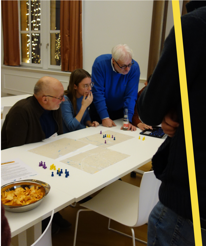
Grimbergenaars plaatsen potentiële en bestaande autodelers op de kaart om te kijken waar het potentieel ligt.