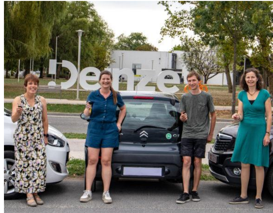
Autobezitters uit Deinze voeren campagne om meer mensen te overtuigen tot autodelen

Uiteraard doet de autodeelaanbieder dat ook. Een derde van de huidige leden vindt de duidelijke uitleg die de aanbieder gaf over de werking van particulier autodelen ook een grote meerwaarde.