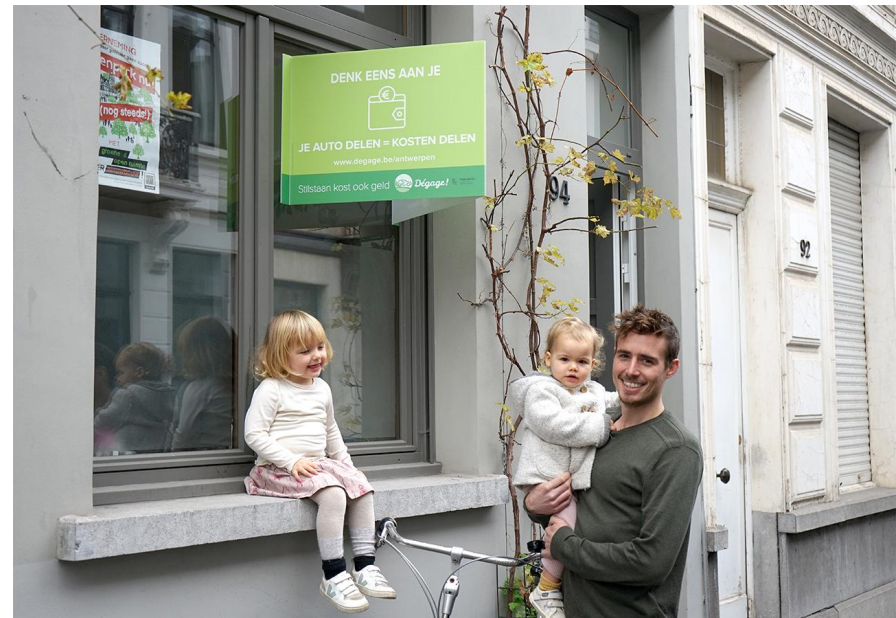
Ward uit Borgerhout promoot Dégage via een raambord

Ons onderzoek toont aan dat de huidige autobezitters die hun wagen delen dat vooral doen omdat ze vinden dat dat goed is voor het milieu en omdat het een positief effect heeft op hun buurt . Er komt namelijk meer plaats vrij op straat, het zorgt voor een betere sociale cohesie enzovoort. Ook voor gebruikers van particulier autodelen zijn dit twee belangrijke redenen om te starten met autodelen.